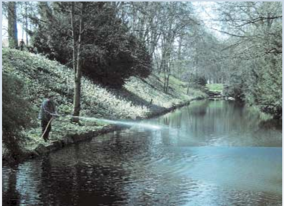
Teich (T0): EMA-Ausbringung im April 2005

Im Norden der Promenade liegen drei Teiche dicht beieinander, die sich auch von ihrer Gestalt her sehr ähnlich sind. Ihre Größe variiert zwischen 996 Quadratmeter und 1862 Quadratmeter bei einer Wassertiefe bis zu circa zwei Meter. Alle Teiche liegen in Muldenlagen, deren Hänge ein Gefälle