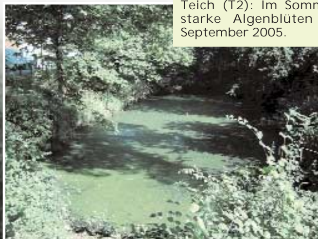
Teich (T2): Im Sommer können starke Algenblüten entstehen, September 2005.

Der größte der oben genannten Teiche (T0) wurde während der Vegetationsperiode 2005 mit dem aktiven, flüssigen EM-Präparat »EMA« aus »EM-Farming« behandelt. Um die Auswirkung der EM-Behandlung auf Gewässer zu untersuchen, wurden sowohl der behandelte Teich (T0), als auch die Teiche (T1+T2) des Grabensystems beobachtet.